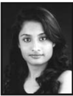
ચિ. નિતી ધનેશ ધુલ્લા ગામ : સેવક ભરડીયા

નોંધ : ડોંબિવલી જ્ઞાતિજનોમાં જે તપસ્વીના ૧૬ ઉપવાસ કે તેથી વધારે તપ હશે તેમને શ્રી સ્વસ્તિક ગ્રુપ દ્વારા નિશુલ્ક ચૈત્ય પરીપાટી કરાવવામાં આવશે. રૂ. ૬૦૦/- ભરી નામ નોંધાવવાની અંતિમ તારીખ ૦૨-૦૯-૨૦૧૩ રહેશે. આ રકમ ચૈત્ય પરીપાટી બાદ તપસ્વીઓને પરત કરવામાં આવશે.