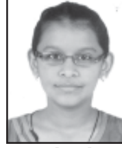
કૃપા ભાવેશ લોડાયા ભાંડુપ SSC 73%